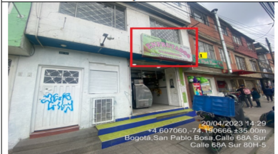
En la cual se evidencia la fachada del establecimiento comercial ENFRUTADOS TODO LO QUE TU PALADAR DESEA, en la que se observa: un (1) elemento publicitario tipo aviso en fachada identificado con el número 1, el cual al momento de la visita técnica se encontraba instalado sin contar con el registro ante la SDA.